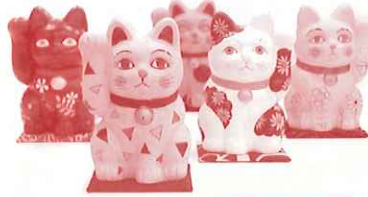
第17回限定招き猫 (作: 櫻井魔己子氏)