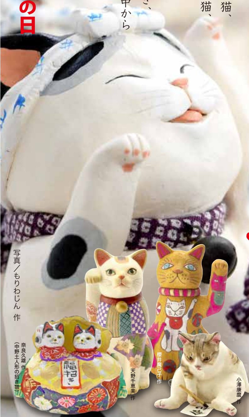
写真/もりわじん作