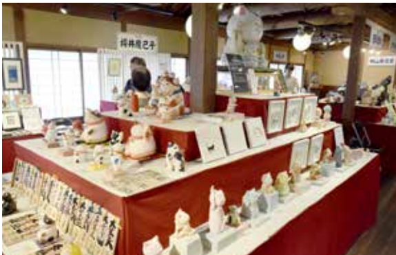
招き猫現代作家展

※各催しの詳細は、期間中おかげ横丁内に設置される案内板と当日チラシをご覧ください。