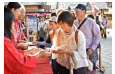
残り福のおすそわけ

昔から「残り物には福がある」といいます。招き猫の日のお祝いに小さな福のおすそ分けをします。