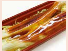
とうふや あなごめし