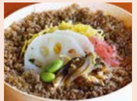
すし久 松阪牛そぼろ寿し