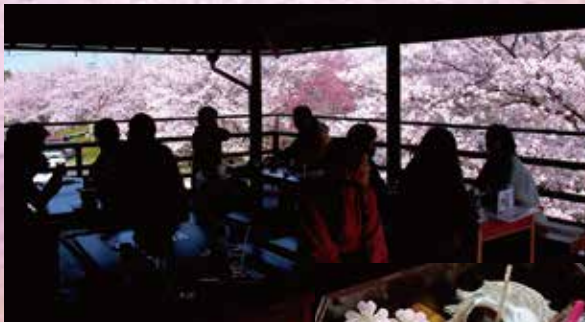
2階 テーブル席 (テラスあり)