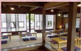
1階 座敷席、テーブル席